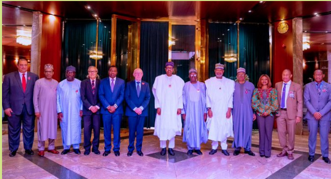
President Muhammadu Buhari of Nigeria received ICAO and AFCAC leaders in Abuja, pledging support to ICAO activities and aviation development in Africa

The Nigerian President, HE Muhammadu Buhari, has expressed commitment to air transport liberalization, aviation development and support to the International Civil Aviation Organization's (ICAO's) activities to drive its Standards and Recommended Practices (SARPs) in Africa. President Buhari disclosed this at the ICAO Air Services Negotiation event (ICAN '22) in Abuja, Nigeria, recently.