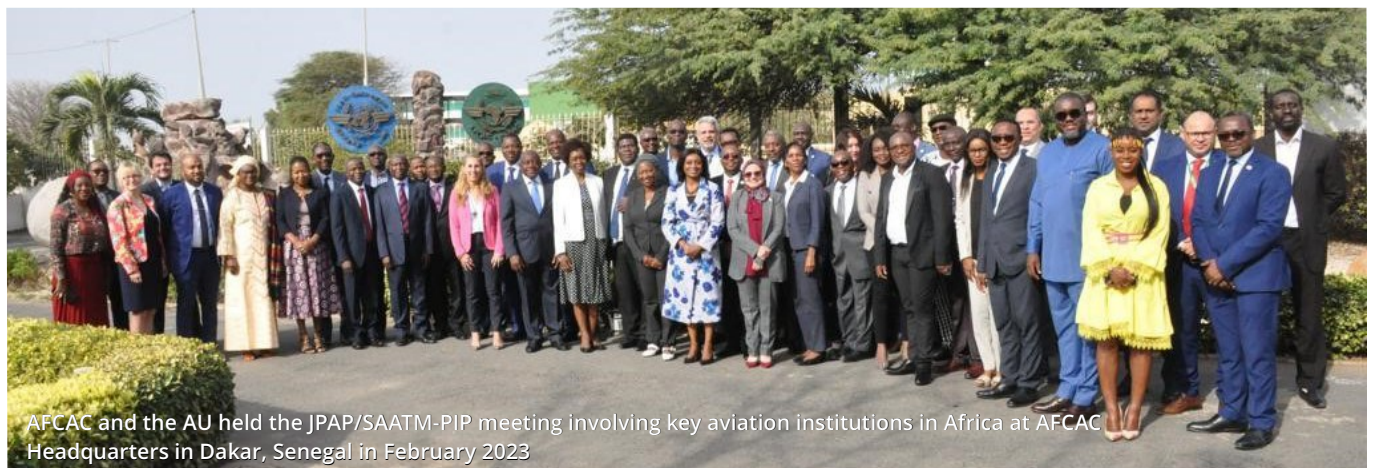
AFCAC and the AU held the JPAP/SAATM-PIP meeting involving key aviation institutions in Africa at AFCAC Headquarters in Dakar, Senegal in February 2023

The African Civil Aviation Commission (AFCAC), in conjunction with the African Union (AU), held the Sixth Meeting of Aviation Industry Stakeholders on Implementation of the Joint Prioritisation Action Plan for the Operationalisation of the Single African Air Transport Market (SAATM) on February 9-10 2023 at AFCAC headquarters in Dakar, Senegal. Essentially, the JPAP/SAATM-PIP event set ambitious targets for 2023 and beyond for the SAATM Ambassadors, as well as Action Groups within States and Regions. The meeting resolved to take "results-based approach"