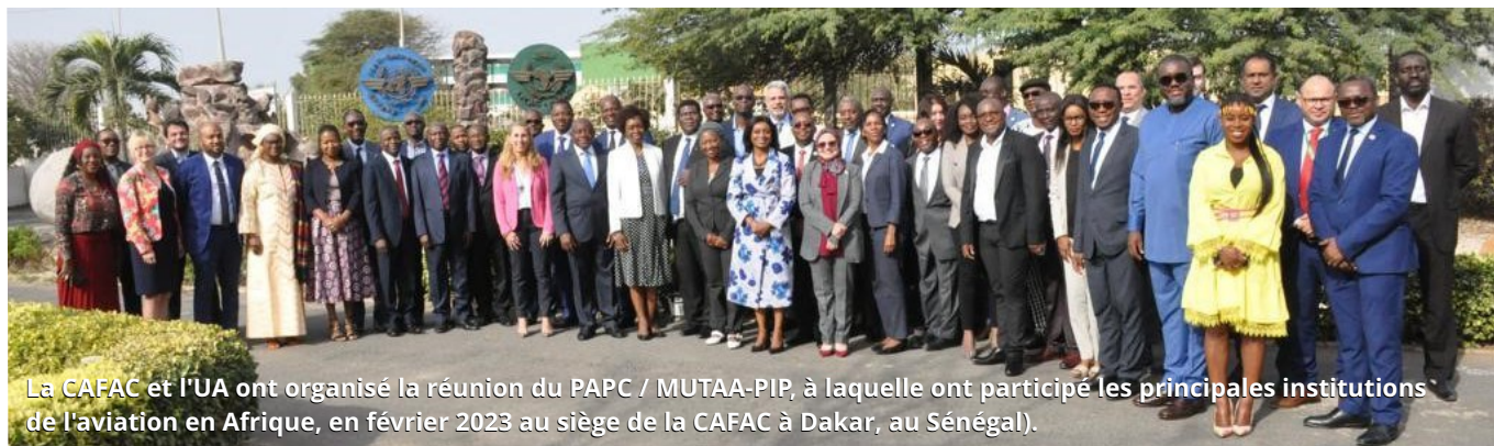
La CAFAC et l'UA ont organisé la réunion du PAPC / MUTAA-PIP, à laquelle ont participé les principales institutions de l'aviation en Afrique, en février 2023 au siège de la CAFAC à Dakar, au Sénégal).

La Commission africaine de l'aviation civile (CAFAC), en collaboration avec l'Union africaine (UA), a tenu la sixième réunion des parties prenantes de l'industrie aéronautique sur la mise en œuvre du Plan d'action prioritaire conjoint pour l'opérationnalisation du marché unique du transport aérien africain (MUTAA) les 9 et 10 février 2023 au siège de la CAFAC à Dakar, au Sénégal. L'essentiel de l'événement PAPC/MUTAA-PIP a été fixé par des objectifs ambitieux pour 2023 et au-delà pour les ambassadeurs du MUTAA, ainsi que pour les Groupes de travail au sein des États et des régions.