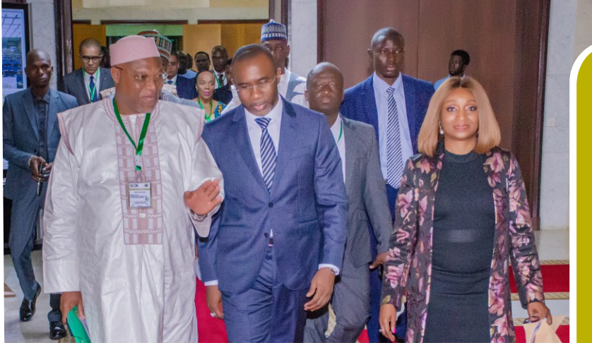
Hon. Affoh Atcha-Dedji, Minister of Air Transport Togo; Hon. Doudou KA, Minister of Air Transport Senegal and Ms Adefunke Adeyemi, Secretary General AFCAC at YD-Day 2022

Championing the new initiative, the Secretary General of AFCAC, Ms. Adefunke Adeyemi revealed that AFCAC, as the Executing Agency of the SAATM/YD, will coordinate robust advocacy engaging top level of governments, Ministers and operators to expand liberalization under the SAATM PIP