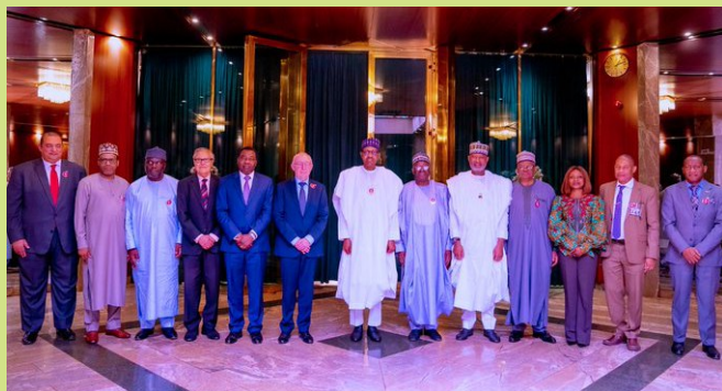
Le président Muhammadu BUHARI du Nigeria a accueilli les dirigeants de l'OACI et de la CAFAC à Abuja, en leur promettant de soutenir les activités de l'OACI et le développement de l'aviation en Afrique

Le président nigérian, S.E. Muhammadu BUHARI, a exprimé son engagement en faveur de la libéralisation du transport aérien, du développement de l'industrie aéronautique et son soutien aux activités de l'Organisation de l'aviation civile internationale (OACI) visant à promouvoir en Afrique les normes et pratiques recommandées (SARP). Le président BUHARI a fait cette révélation lors du dernier événement de l'OACI sur les négociations relatives aux