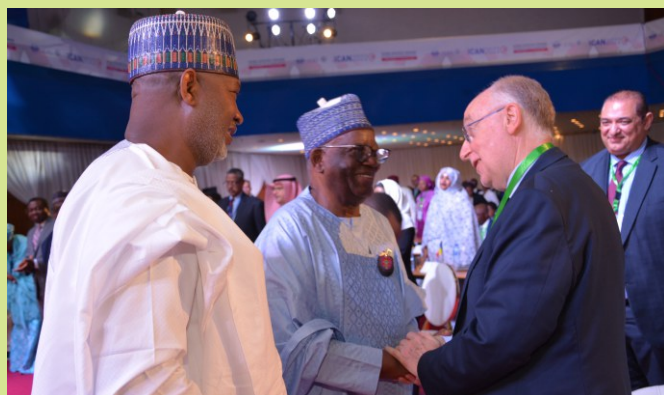
Sen. Hadi Sirika, Minister of Aviation, Nigeria; Prof. Ibrahim Gambari, Chief of Staff to Nigerian President; and Mr. Salvatore Sciacchitano, President ICAO Council during ICAO CAN 22 Abuja.

The President of the International Civil Aviation Organization (ICAO) Council, Mr. Salvatore Sciacchitano, has said the future of air travel should continue to be used for knowledge building and