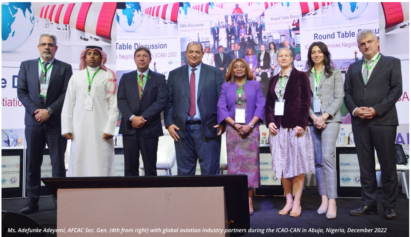
Ms. Adefunke Adeyemi, AFCAC Sec. Gen. (4th from right) with global aviation industry partners during the ICAO-CAN in Abuja, Nigeria, December 2022

The implementation of the Single African Air Transport Market (SAATM) has received a major boost as a number of African States embraced the YD-compliant Air Service Agreement (ASAs) among themselves during the ICAO Air Services Negotiation Conference (ICAN) in Abuja, Nigeria recently. According to the Secretary General of the African Civil Aviation Commission (AFCAC), Ms. Adefunke Adeyemi, AFCAC developed the YD-compliant Air Services Agreement template which will fast-track liberalization of air transport in Africa.